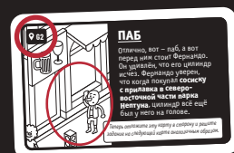
Обратная сторона карты дела

Нельзя просто гадать! Вы всегда должны найти конкретную сцену на карте города, подтверждающую ваши выводы.