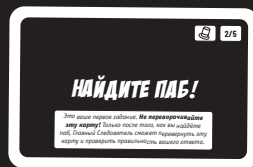
Лицевая сторона карты дела

• На лицевой стороне второй карты, теперь верхней в колоде, указано ваше первое задание в этом деле. Главный Следователь читает задание вслух, не переворачивая карту .